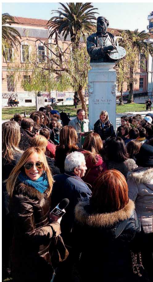
BARLETTA Buon compleanno De Nittis

Nei giardini intitolati al grande artista ed esattamente presso il monumento realizzato nel 1934, e che lo rappresenta con maestria e somiglianza mentre imbraccia tavolozza e pennelli, nell'at-